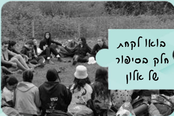
באלון אקדח חלק בסיפור של אלון

אביו העמידו במבחן האומץ: הניח לו לפעול בעצמו ולגלות תושייה ואחריות, אולם באהבתו לבנו לא התרחק והגן עליו בשעת סכנה. לימים, כשהיה ללוחם אמיץ, מנהיג מדיני ומופת לאהבת הארץ, שינה את שמו ל יגאל אלון בהשראת אותו הלילה.