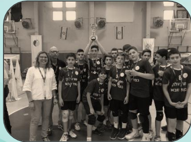
נבחרות כדור עף

בכל שנה נפתחות קבוצות פעולה לפיתוח מעורבות חברתית ואזרחות פעילה. התלמידים מוזמנים לפעול ולתרום במסגרות מיוחדות כמו: "אות הנוער", מתנ"סים, איסוף מזון, איכות הסביבה, סיוע בגני ילדים, סיוע לילדים בעלי צרכים מיוחדים, שילוב במתנ"סים ובמועדוניות ועוד.